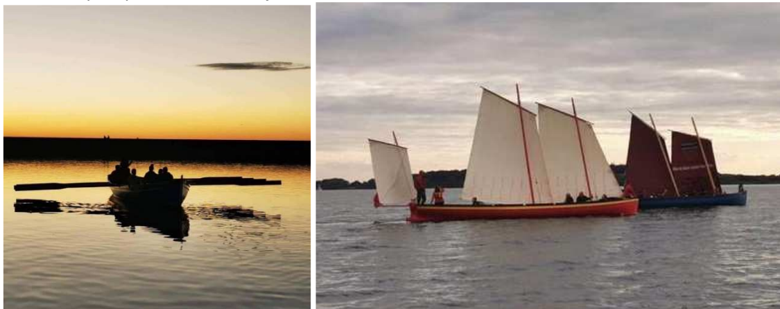
Stages de voile et d'aviron au Lac d'Orient.