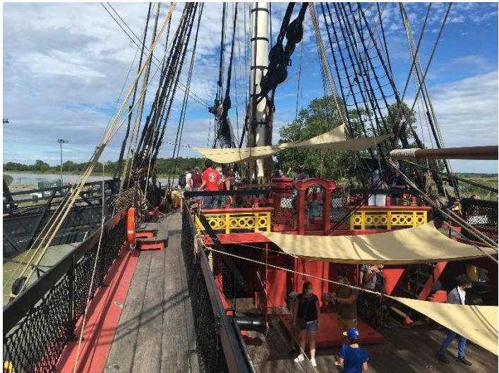
Voyage d'études à L'Hermione à Rochefort...