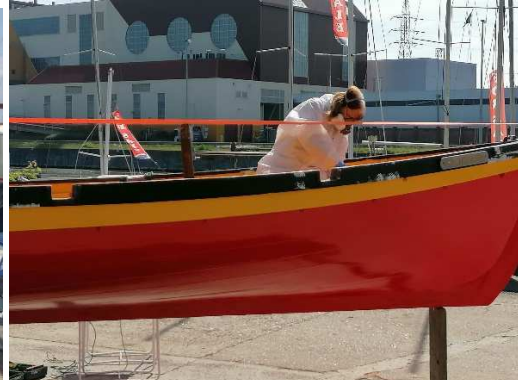
Travaux de rénovation de Penguin, Uilenspiegel et Javelot