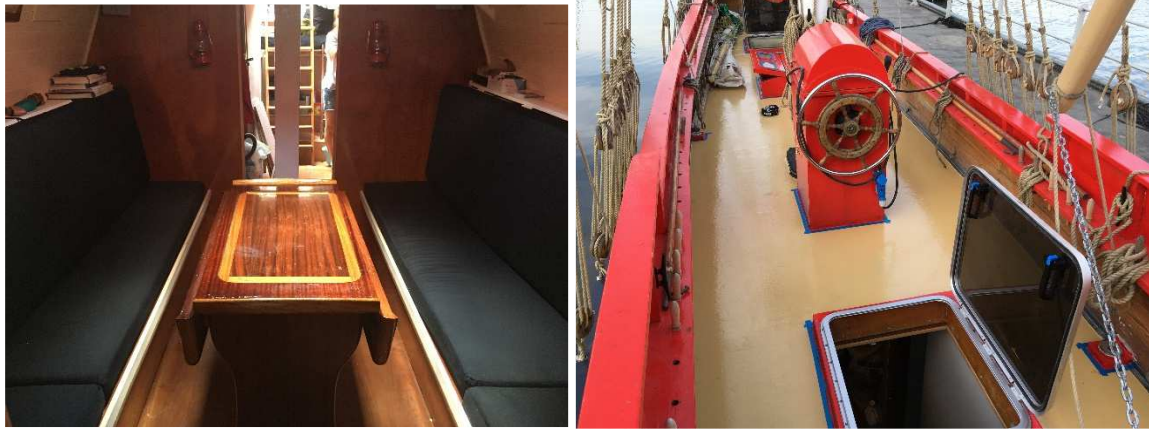
Aménagement intérieur et travaux de pont de La Licorne