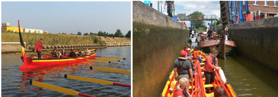
Sorties en yole pour maisons de jeunes, Row After Work, séniors et Raid sur la Haute Sambre