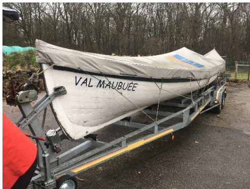
Don d'une Yole à Anvers