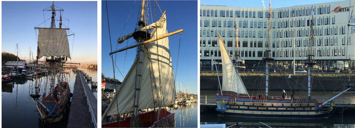
Installation des 4 premières voiles de La Licorne en fin d'année